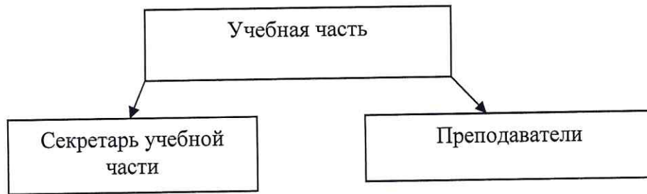
Рисунок 1. Организационная структура АНО ЦДПО «КРАСПРОФ»

На основании действующих нормативных регламентирующих документов в АНО ЦДПО «КРАСПРОФ» разработаны локальные акты и положения, регламентирующие образовательную деятельность: